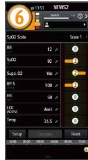
Панель EWS на мониторах ePM