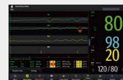
Просмотр и анализ Просмотр кривых за 24 часа и тревог высокого приоритета