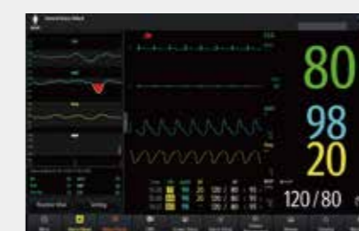
Обход палат или передача пациента Быстрое указание на изменение состояния пациента