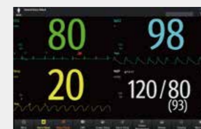
Мониторинг на расстоянии Наглядные крупные цифры

Основываясь на клинических данных, в мониторах ePM были оптимизированы рабочие процессы - доступна опция перелистывания между наиболее часто используемыми функциями и интерфейсами, что позволяет ускорить и сделать более точным решение клинических задач.