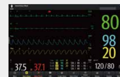
Мониторинг у койки Подсветка значений, выходящих за границы нормы